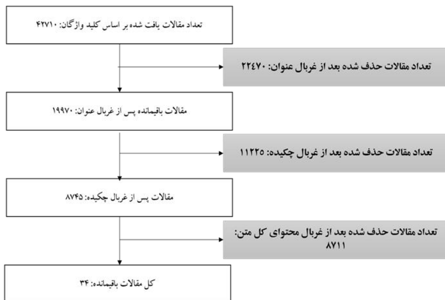
شکل ۲- نمودار چارت روند نما