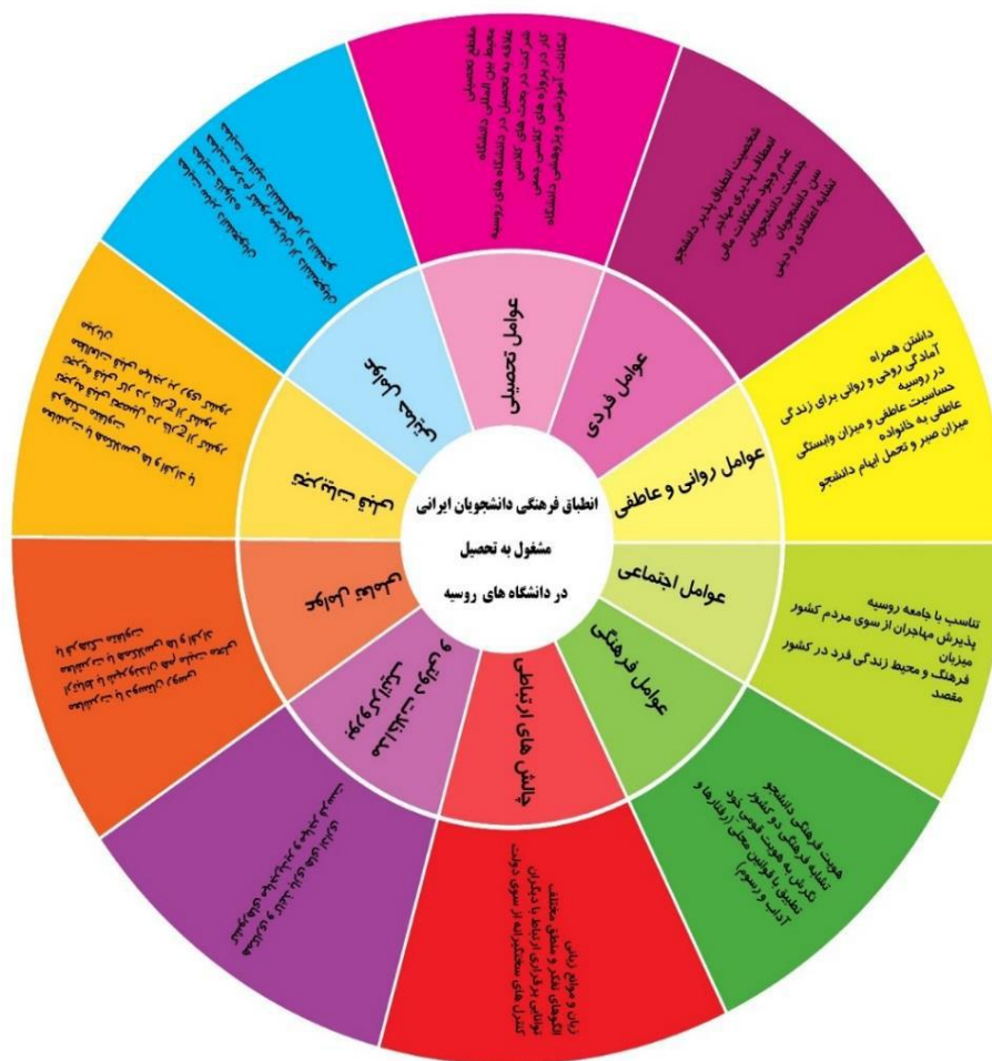
شکل ۱. مدل انطباق فرهنگی دانشجویان ایرانی مشغول به تحصیل در دانشگاه های روسیه