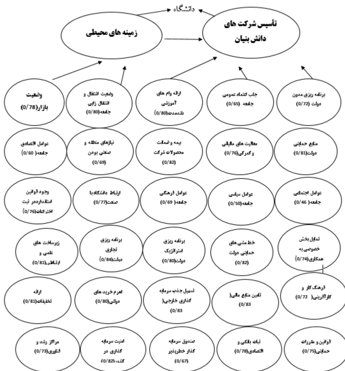
شکل 2. مدل نهایی بر اساس یافته های پژوهش